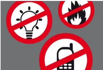
Keine Flammen, keine Funken!

Erdgas riecht dank des beigemischten Duftstoffs so intensiv, dass selbst kleinste Gasmengen wahrgenommen werden. Entzündlich ist es jedoch nur in spezifischen Luft-Erdgas-Mischverhältnissen und nur durch einen auslösenden Funken. Schlägt Ihre Nase also Alarm, ist das noch kein Grund zur Panik. Bleiben Sie ruhig und beachten Sie die folgenden Punkte: