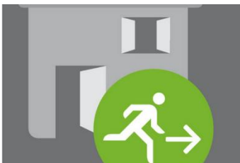
Mitbewohner warnen!

Schließen Sie die Absperrrichtungen der Gasleitungen.