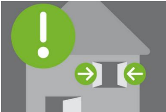
Fenster auf!

Riecht es nach Erdgas, ist offenes Feuer tabu. Also Zigaretten aus, kein Feuerzeug und keine Streichhölzer benutzen! Auch an elektrischen Geräten können Funken entstehen. Deshalb: Licht- und Geräteschalter nicht mehr betätigen, keine Stecker aus der Steckdose ziehen. Und kein Telefon oder Handy im Haus benutzen!