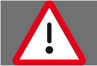
Keine Panik!

So verhalten Sie sich richtig bei Erdgasgeruch!