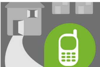
Bereitschaftsdienst anrufen – außerhalb des Hauses!

Warnen Sie Ihre Mitbewohner ( Wichtig: klopfen, nicht klingeln!) und verlassen Sie so schnell wie möglich das Haus.